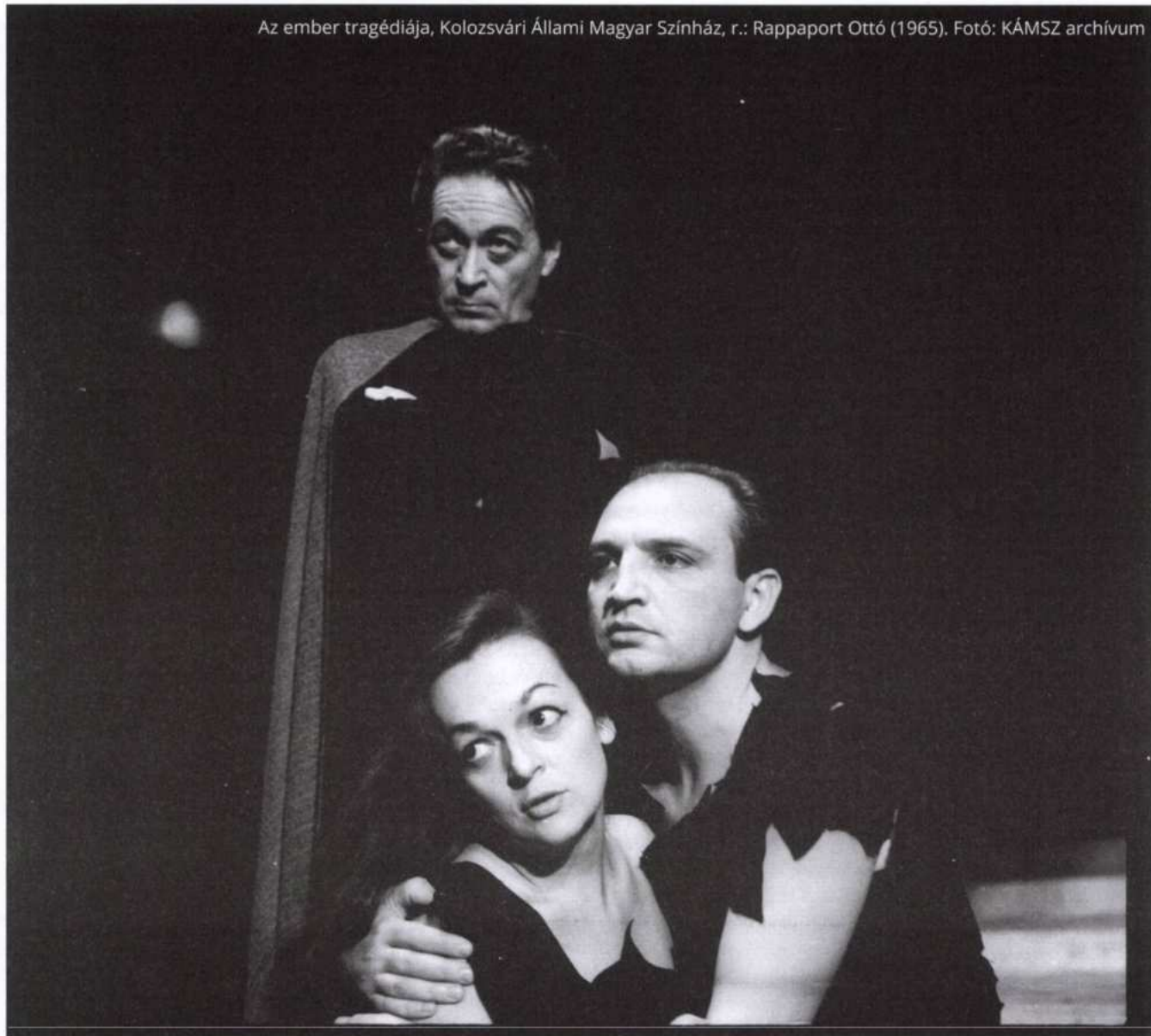
Az ember tragédiája, Kolozsvári Állami Magyar Színház, r.: Rappaport Ottó (1965).

– 1990 előtt a színházaknak az MTI fotózott, de miután a színházi lapnak más szempont szerint készült képekre volt szüksége, inkább saját fotóst foglalkoztatott. Ez volt nálunk Ikládi László. 1990-ben megszűnt az MTI monopolhelyzete, ekkor kezdett kialakulni az a gyakorlat, hogy a színházak saját